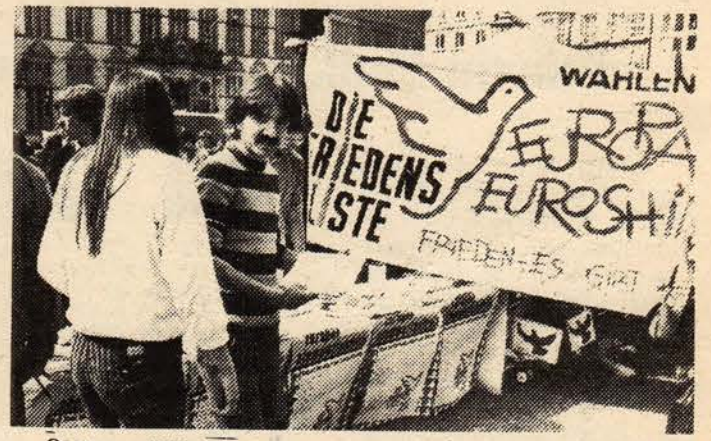
Ostern yürüyüşlerinde barış güvercini pankartları süslüyor.

lepleri etrafında yapılan bu yılki Ostern barış yürüyüşlerinin diğer bir özelliği de, yürüyüşlere her zamankinden daha çok sayıda sendikacıların ve sosyal demokratların katılma-