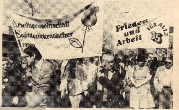
Manheim'de Oster yürüyüşlerinde sosyal demokrat kadınlar