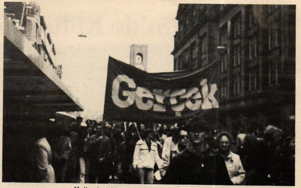
Hollanda 1 Mayıs yürüyüşünde Gerçek pankartı dikkatleri çekiyordu